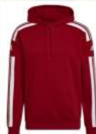
Sweat à capuche Squadra 21