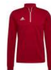
Entrada 22 Men's Trainingwear