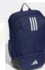
Tiro League Backpack Navy Blue