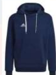
Sweat à capuche Entrada 22