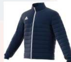
Entrada 22 Light Jacket