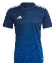
GAMME TEAM ICON 23