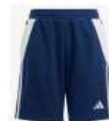
Short poche zippée