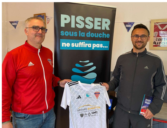
Team for the Planet