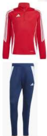
Survêtement Club ASR